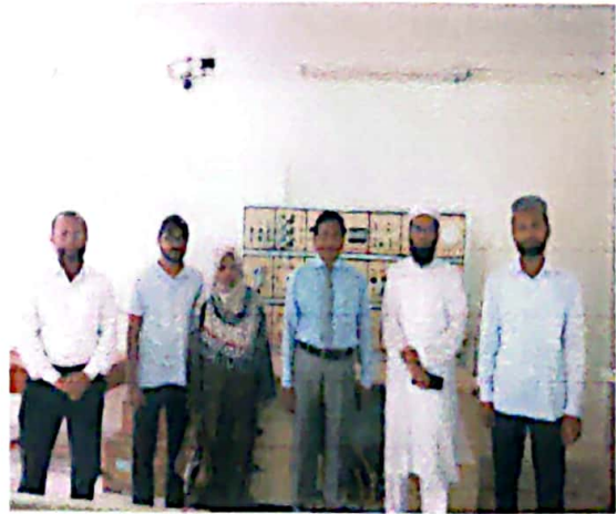
অভিভাবকবৃন্দের ল্যাব ও ওয়ার্কশপ পরিদর্শন