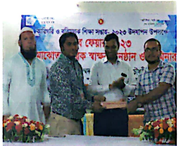
শিল্প-কারখানা ও প্রতিষ্ঠানের মধ্যে “সমঝোতা স্মারক” স্বাক্ষরের খবরচিত্রঃ