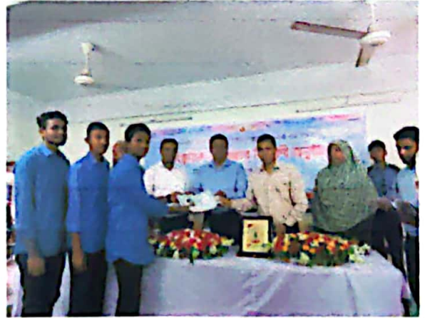
পুরস্কার বিতরণী অনুষ্ঠান এর খন্ডচিত্রঃ

প্রধান অতিথি তার বক্তব্যে শিক্ষার্থীদের উত্থাপিত দাবিগুলো উপজেলা পরিষদের পক্ষ থেকে দ্রুত সময়ের মধ্যে পূরণ করার আশ্বাস দেন। তিনি ২০৪১ সালের মধ্যে স্মার্ট বাংলাদেশ বিনির্মাণের প্রত্যয়ে নিজেদেরকে দক্ষ করে গড়ে তোলার আহবান জানান।