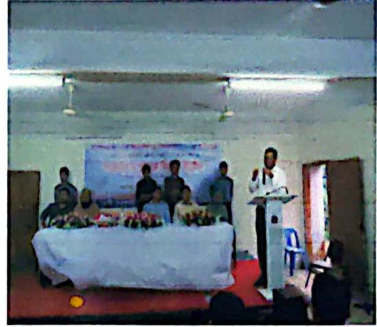
প্রধান অতিথি ও অধ্যক্ষ মহোদয়ের বক্তব্যের স্থির চিত্র